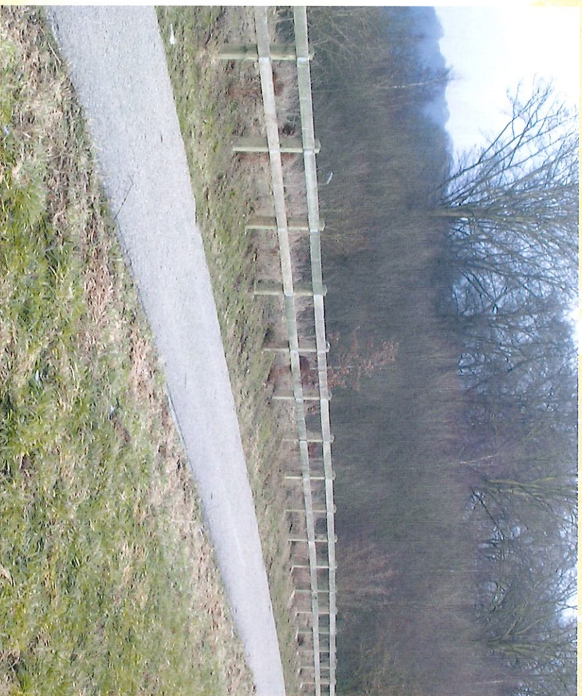
Sentier ceinturant le lac de la Plate Taille à hauteur de l'Adeps - Pad rond het meer van "La Plate Taille" op de hoogte van l'Adeps

Een leuke wandeling die geschikt is voor iedereen.