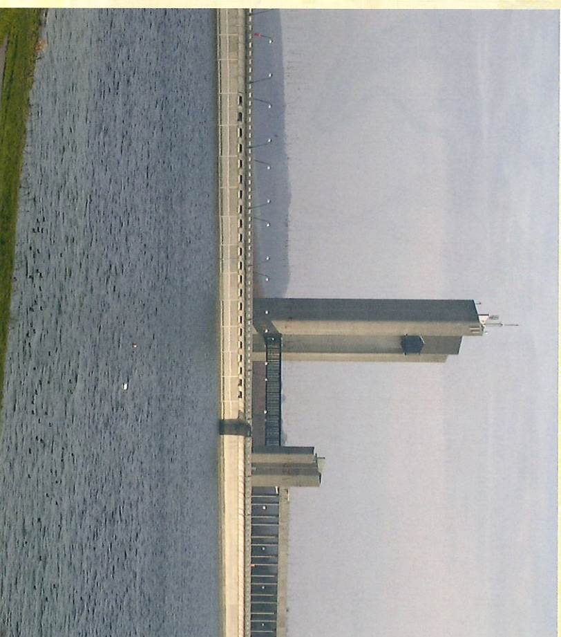
Barrage de la Plate Taille - Tour panoramique - Stuwdam van "La Plate Taille" - Panoramatoren

Promenade pour tous au cours de laquelle chacun trouvera son bonheur.