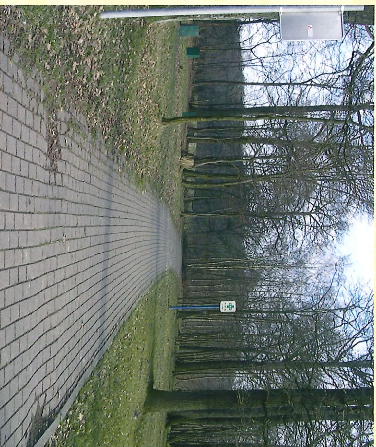
Sentier ceinturant le lac de la Plate Taille à hauteur du quai de mise à l'eau des planches à voile Pad rond het meer van 'La Plate Taille' op de hoogte van de kade voor windsurflanken

Profitez de cette promenade pour vous ressourcer et passer un agréable moment en famille. Après votre passage sur le site des lacs, appréciez le retour vers le centre du village de Bousu-lez-Walcourt par nos paisibles sentiers et routes de campagne.