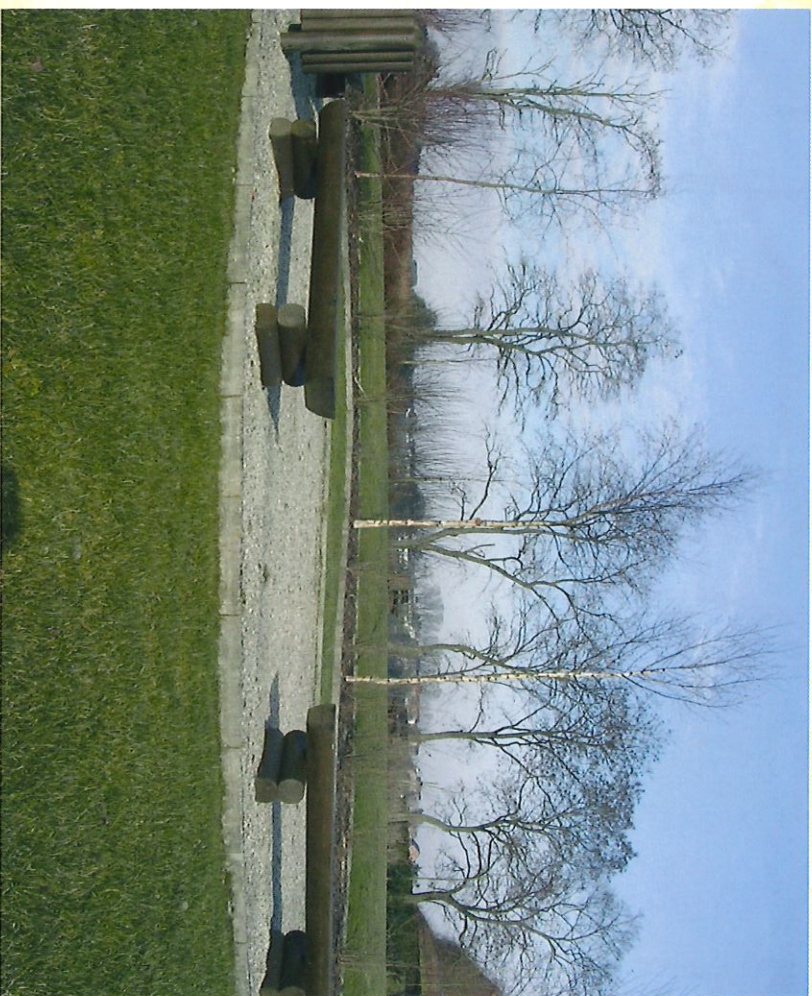
Aire de repos de l'ancienne carrière de Bousu-lez-Walcourt - Haltedplaats van de vorige steengroeve van Bousu-lez-Walcourt

Profiteer van deze wandeling om u te herbronnen en een aangenaam moment in gezinsverband te beleven. Na uw bezoek aan het meengebied keert u langs rustige plattelandswegen terug naar het dorp Bousu-lez-Walcourt.