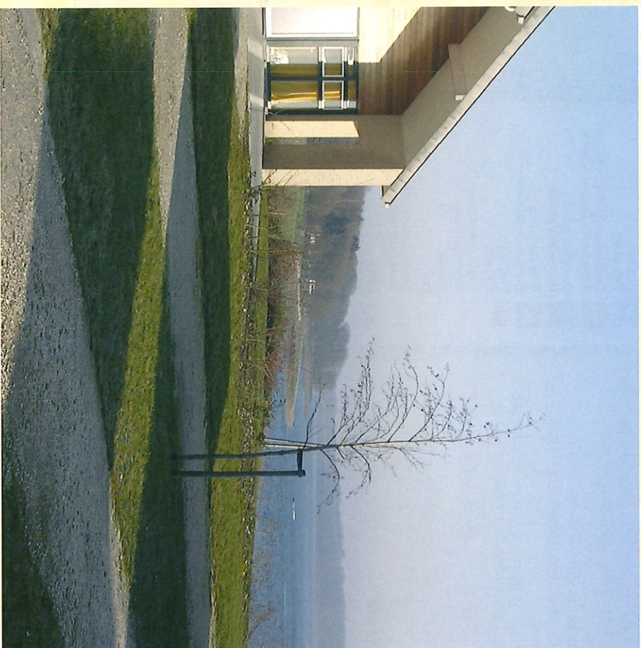
Vue sur le lac de la Plate Taille du village vacances Landal - Zicht op het meer van "La Plate Taille" vanaf het vakantieoord Landal

Vous pourrez y apprécier tantôt d'agréables petits quartiers, un étang, la station touristique, ... Bref, des paysages très variés qui feront le bonheur de tous.