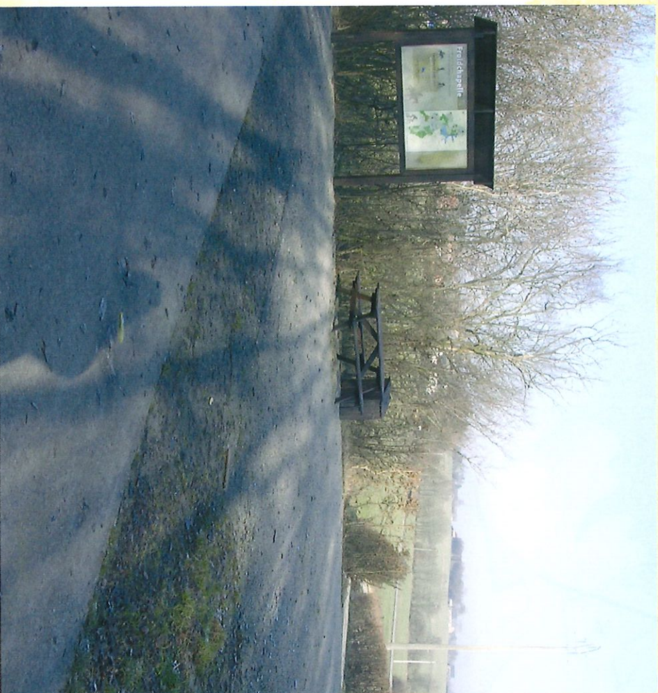
Chemin de liaison du Ravel 109 à la Station touristique - Verbindingspad Ravel 109 met het toeristische domein

U komt langs aardige wijken, een vijver, het toeristische domein... Kortom, afwisseling is troef.