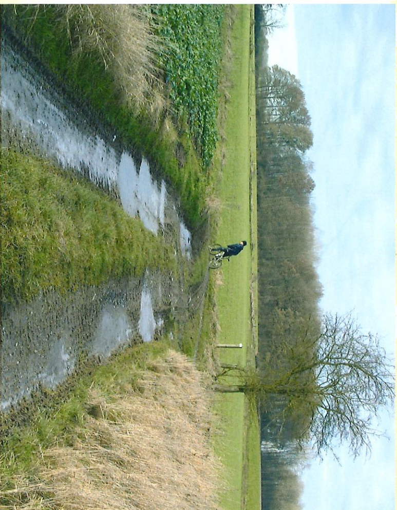
Chemin du lieu dit "La Goutte" - Pod van het buurschap "La Goutte"

Iedere stap op ons platteland zal u een gevoel van vrijheid geven.