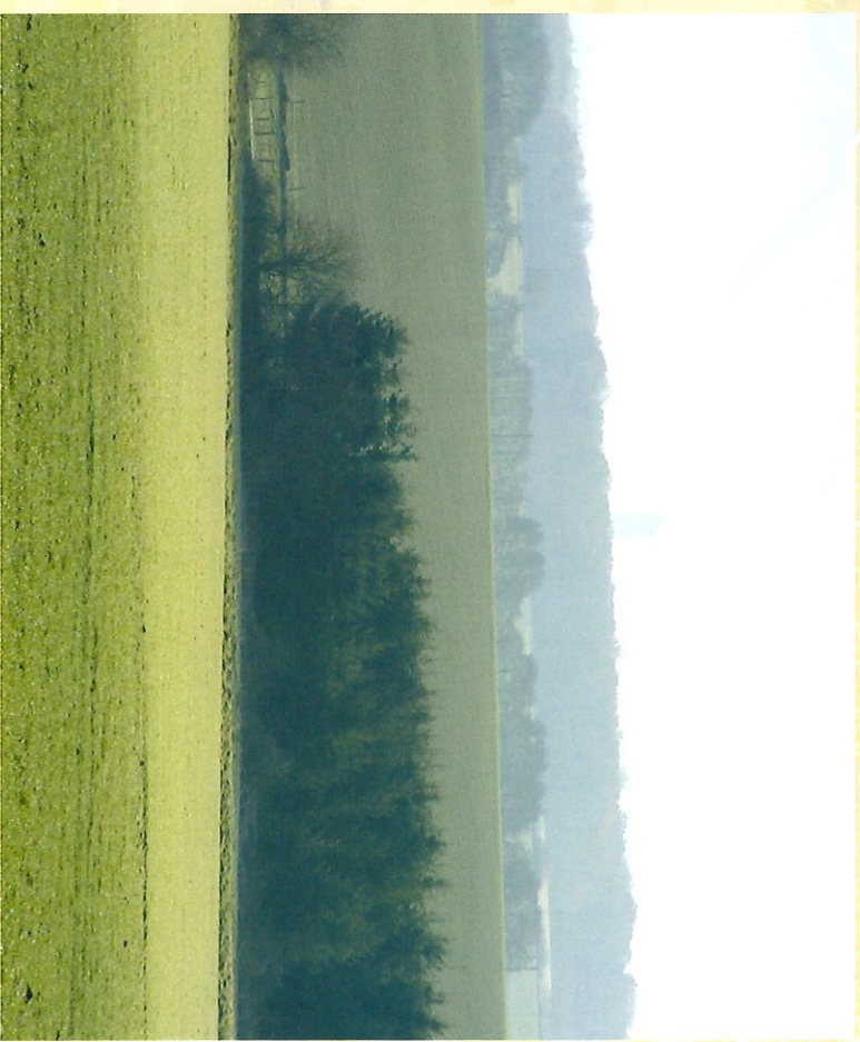
Vue sur la forêt entourant les lacs avec la tour panoramique en arrière plan - Zicht op het bos rond de meren, de panoramische toer achtergrond

Chaque pas dans nos campagnes vous envahira d'une sensation de liberté.