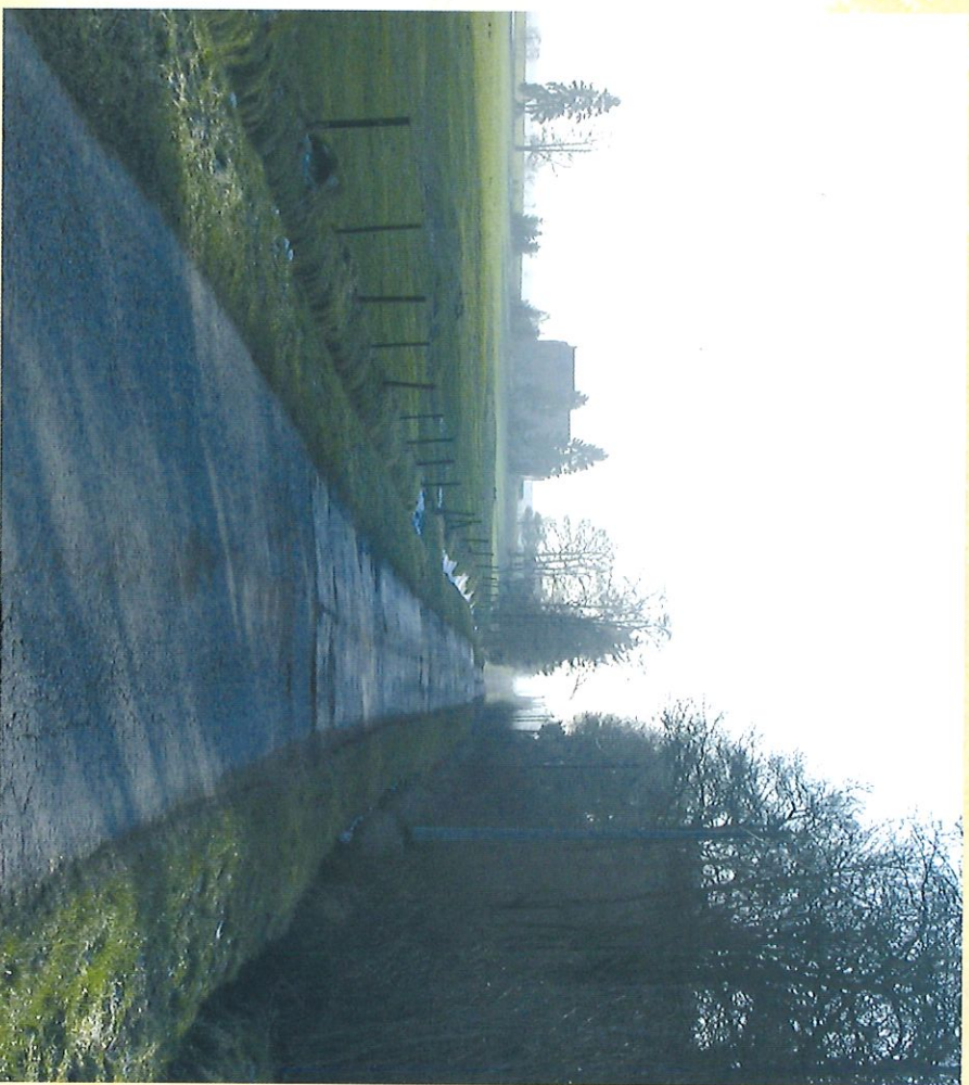
Rue du Bois Lecomte - "Rue du Bois Lecomte"

Profiteer van de uitzonderlijke uitzichten en de gezonde plattelandslucht om u te herbronnen.