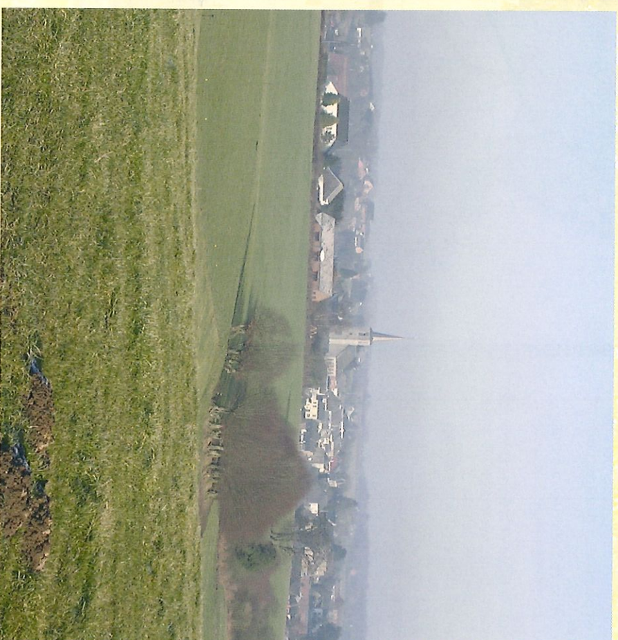
Vue panoramique de Froidchappelle de la rue de Massus - Zicht op Froidchappelle vanaf de "rue de Massus"

Profitez des vues exceptionnelles et du grand air de nos campagnes pour vous ressourcer.