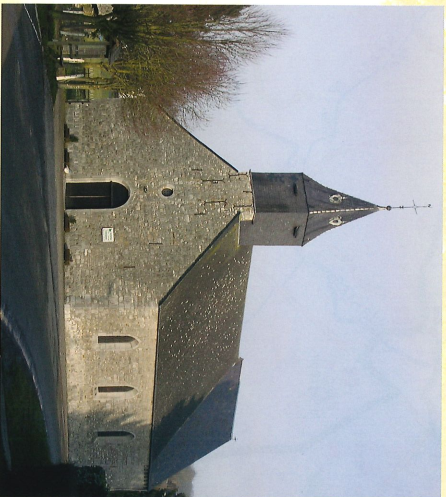
Eglise de Fourbechies - Kerk van Fourbechies

Met uitzondering van het dorpscentrum dat zich in een inzinking bevindt, verloopt de wandeling vooral op de hoogtes. U mag zich dus aan een waarder van gevarieerde landschappen verwachten.