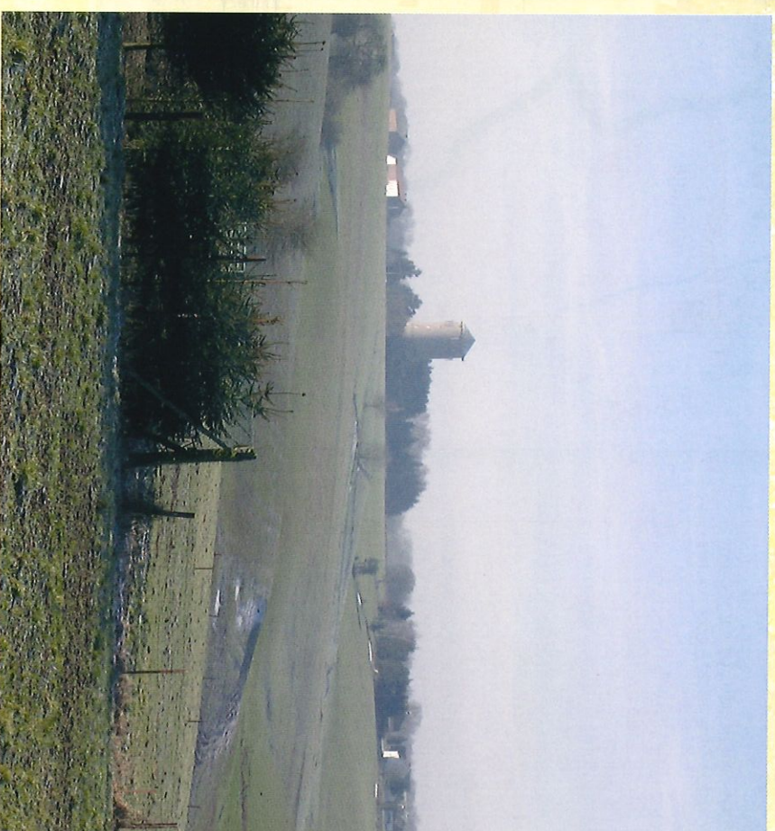
Vue panoramique de la rue Fosse au sable sur le château d'eau - Zicht op het waterkasteel, vanaf de "rue Fosse au Sable"

Excepté le centre du village qui se trouve dans une fosse, l'essentiel de la promenade se poursuit sur les hauteurs. C'est donc un véritable panel de paysages très divers qui s'offre à vos yeux.