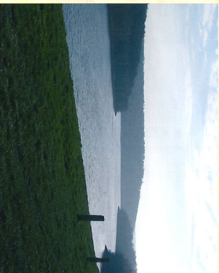
Vue sur le lac de l'Eau d'Heure du Belvédère - Zicht op het meer van l'Eau d'Heure vanaf de panoramatoren

Avant de retourner vers le village, et pour clôturer cette promenade en beauté, profitez de votre passage devant la Ruchette (5) pour y déguster un petit verre d'Hydromel.