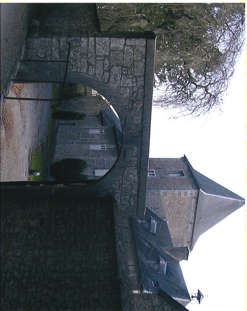
Château-Ferme de Boussu-lez-Walcourt - Kasteel-boerderij van Boussu-lez-Walcourt

Voordeleer terug te keren naar het dorp en om in schoonheid af te sluiten, zou u een glaasje Hydromel kunnen proeven wanneer u voorbij la Ruchette (5) passeert.