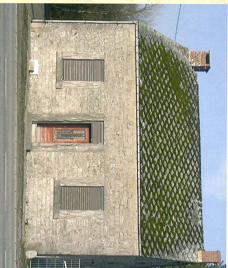
Ancienne demeure de marbrier de "la Carrière à Roc" - Vorig huis van de marmerbewerker van "La Carrière à Roc"

C'est en fait un petit bout de l'histoire de Froidchappelle que vous découvrirez par le biais de cette promenade.