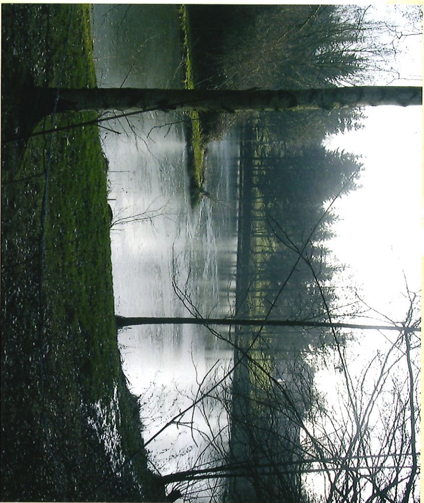
Etang privé de "La Carrière à Roc" - Privaat vijver van "La Carrière à Roc"

Deze wandeling laat u in feite een stukje geschiedenis van Froidchappelle ontdekken.