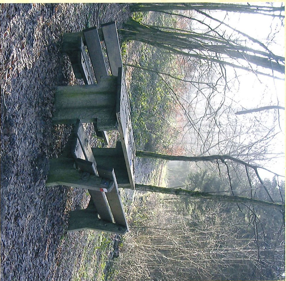
Aire de repos du Bois des Hamaides - Hotieplacats van het bos van "Les Hamaides"

Sachez profiter pleinement de ces simples et tellement agréables moments.