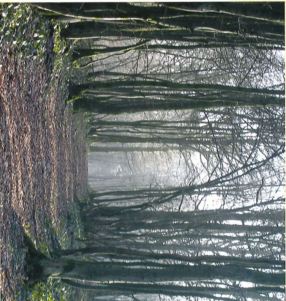
Sentier du Bois des Hamaides - Pod van het Bos van "Les Hamaides"

Profiteer van deze eenvoudige maar aangename momenten.