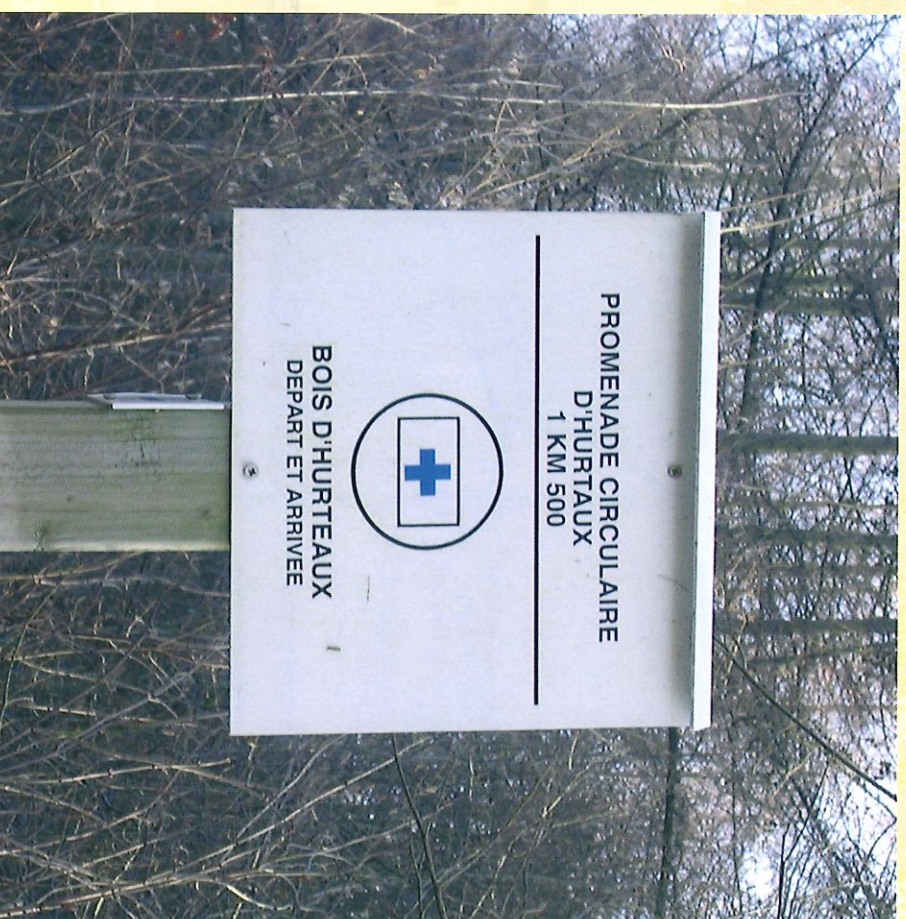
Sentier du Bois d'Hurtaux - Pad van het Bos van "Hurtaux"

Profitez pleinement de ces simples moments de bonheur au sein de nos forêts pour vous ressourcer.