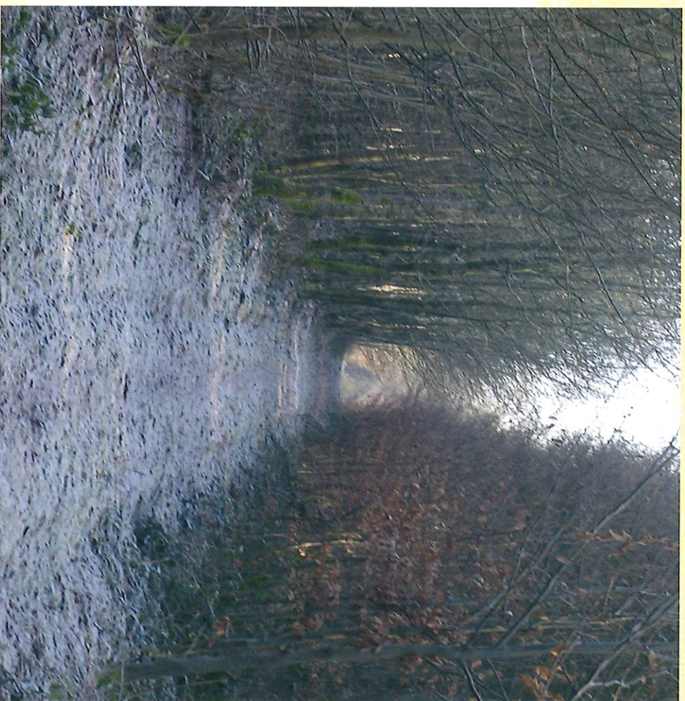
Entrée du Bois d'Hurtaux - Ingang van het Bos van "Hurtaux"

Geniet van een heerlijk moment in onze bossen om u te herbronnen.