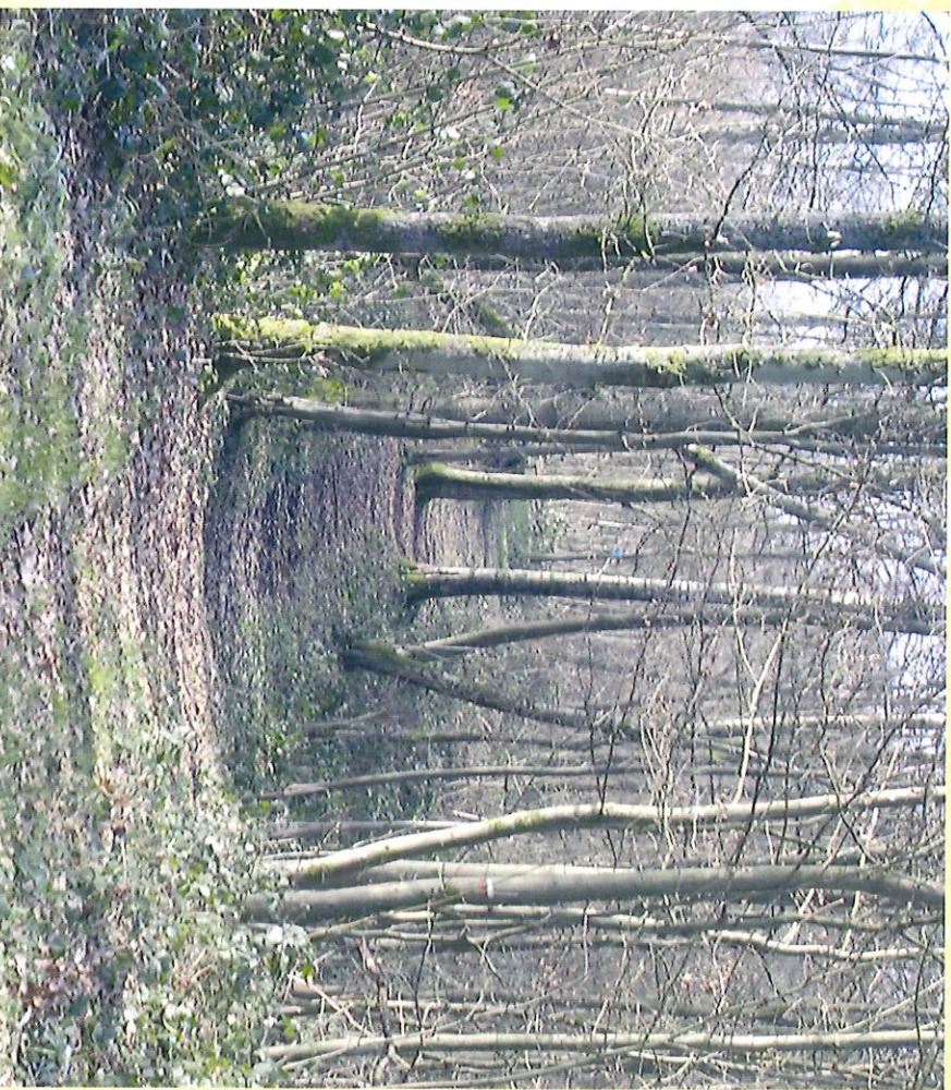
Bois du Grand Berceau - Bos van de Grand Berceau

Om uw natuurhonger helemaal te stillen, kunt u de wandeling met enkele kilometers verlengen. De lus van het bos van Hurtaux is 1,5 km (1) (wegwijzer + ) lang en de lus van les Hamaldes (2) (wegwijzer ◆ ) laat u 2 km verder doordringen in de bossen.