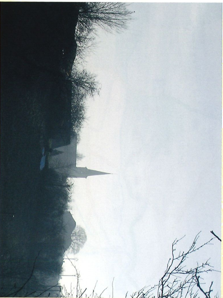
Vue sur le centre de Froidchappelle du lieu-dit "La Tourpène" - Zicht op het centrum van Froidchappelle vanaf de buurtschap "La Tourpène"

U eindigt uw wandeling op de bospaden van le Grand Berceau. Als u er nog de moed voor vindt, dan kunt u zich wagen aan de sportieve geneeften van de Vita trimbaan en – waarom niet – uw dag afsluiten met een barbecue.