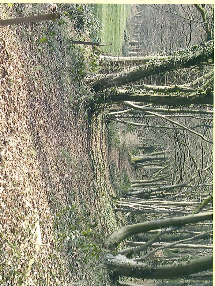
Bois de Piccul - Bos van Piccul

Vous terminerez la promenade dans les sentiers du bois du Grand Berceau où, si vous avez encore du courage, vous pourrez vous adonner aux joies du sport sur la piste Vita et, pourquoi pas, clôturer le tout par un bon barbecue.